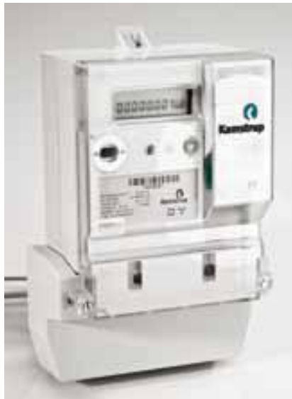
Den nye Bi-måler - Kamstrup 382

Den nye Bi-måler bliver en "intelligent" måler, som kan måle op til 8 tidsintervaller/tariffer i døgnet. Måleren kan aflæses trådløst via en USB-nøgle samt flere fremtidssikrede funktioner.